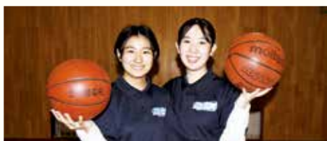
女子バスケットボール部

少人数ですが、日々楽しく練習しています。合同チームでは他校との仲も深められます。