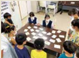
小学生に英語を教えるプロジェクト