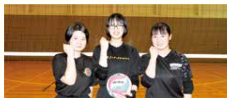
女子バレーボール部

1年生は2名と少ないですが、日々の練習を怠らず、実戦で発揮できるよう努力しています。