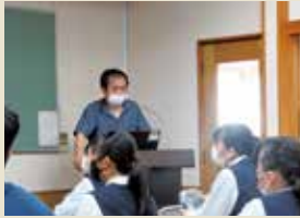
まちづくり講演会