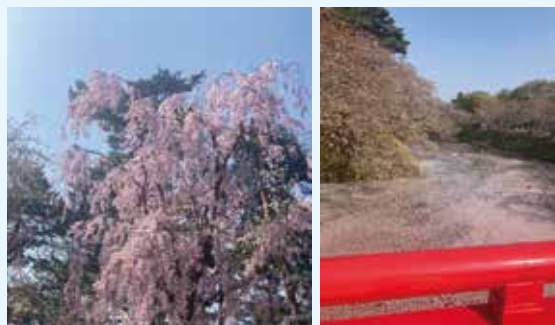
弘前城の桜は最高です↑ オンライン留学の参加証→

大学生は、アルバイト、サークル、一人暮らしなど自分から経験することが増えてきます。名前には「学生」とつきますが大学生は社会人と同じだと考えているので立派な大人です。皆さんの進路、応援しています！