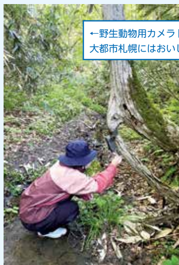
←野生動物用カメラトラップ設置の様子です 大都市札幌にはおいしいお店が沢山あります！

自分がやりたいことができ、知らなかったことを学ぶことができ、とても充実した学生生活を送っています。