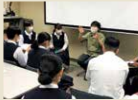
岩手大学の先輩から話を聞く