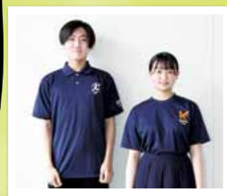
ポロシャツ・Tシャツ