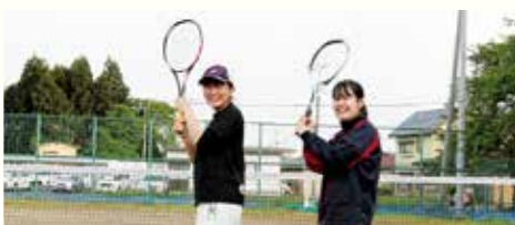
女子ソフトテニス部