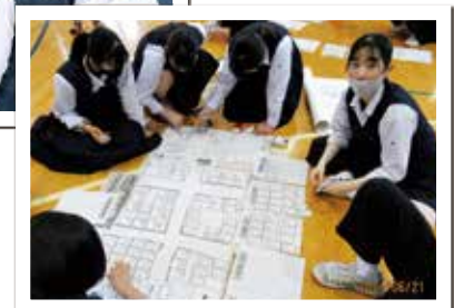
HUG (避難所運営ゲーム) の様子