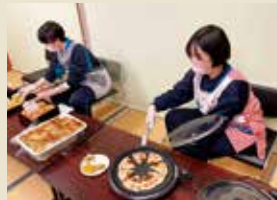
子ども食堂ボランティア